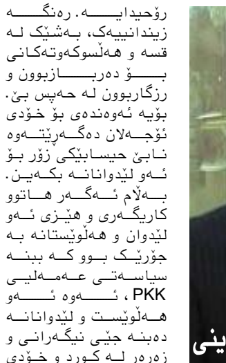
با به شیخ حسه یی

رۆحیدایه. ره نگه زیندانییه ک، به شیک له قسه و هه لسوکه وته گانی بۆ ده ربازبوون و رزگاریبوون له حه یس بی. بۆیه ئه وه ندی بۆ خۆی ئۆجه لان ده گه رپیتیه وه نابی حیسابیکی زور بۆ ئه و لیدوانانه بکهین. به لاه ئه گه ره هاتوو کاریگه ری و هیز ی ئه و لیدوان و هه لۆیستانه به جۆریک بوو که ببه سیاسی عه مه لیی PKK، ئه وه ئه و هه لۆیست و لیدوانانه ده بنه جیی نیگه رانی و زه ره ره له کورد و خۆی