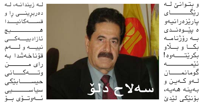
سه لاح دلۆ

"سه عدی ئه حمهد پیره،" ئه ندای مه کته به ی سیاسی یه کتیی نیشتمانی کوردستان به دوری زانی که ئه و لیدوانه هی عه بدوللا ئۆجه لان بی و هاوکات ئۆجه لانی به که سیک زیندانی ناساند که حقه قسه و قسه و بریارانی نییه و وتی: "کاک عه بدوللا ئۆجه لان که سیک زیندانییه و بۆچوونه گانی شه ی زیندانییه. یانی ئازادیی راده ربیری نیه و بۆ ئیجه که سیک که له زیندانی بی، حقه قسه ی نیه هه تا ده رده چی و ئه وه ته عبیر له بۆچوونی خۆی ده کا. ئیجه پیمانویه له قسه ی خۆی ناچی، قسه یه که بۆیان نووسیوه و ئه گه ره له قسه ی خۆیشی بچی، تا له زیندانه قسه مان نیه، که له زیندان به ربوو قسه یه کی لی ده کهین. که سیک که له زیندانی بی حقه قسه یه قه راری نیه، چۆنکه ئازاد نیه تا قه راری ئازاد بدا. که سیک له ئاستی ئه و، له زیندانی وک زیندانی ئه و بی و بتوانی له رێگای پارێزهرانیوه به پپوه ندی هه رۆژنامه بکا و بلاو بکرتیه وه! ئیمه گومانمان له و کهین و بهینه هه یه، بۆنیک لیڤئ