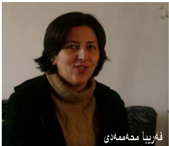
فه ریبا محمه مده ی

له لایه کی دیکه وه، کویستان فتووحی، ره تی کردوه که ژنان کاریگه رییه کی شه وتویان له سه ر پرسه سیاسیه کانددا هه یی و وتی: "ژنان له زۆریه ی حیزبه سیاسیه کانی کوردستاندا، به داخه وه، نه گه یشتونه ته پله و پایه یه که تا بتوانن کاریگه رییان له ژنانی سیاسیی حیزبایه تی دا هه بی. هه رچه ند زۆر ژنی چالاک و لێها توو هه یوون و هه ن له ریزی شه و حیزبانه دا، به تاییه تی شه گه ر باسی حیزبی دیموکرات بۆ بکه م،