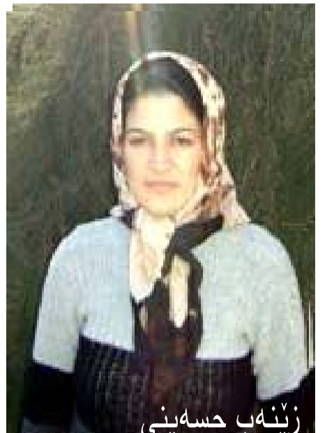
زینه ب حسهینی

ریزه کانی خۆیه وه و ژنان وه کوو پێشمه رگه نینیدا به شدارییان کردوه، هه سه ت ده که ی به جو ریکی دیکه یه. هه رچه ند ژنان له حیزبه کانی دیکه شدا به شدار بوون، به لām کۆمه له شه وه ی شکاند و هاته پێشه وه و ژنانی هینایه ریزه کانی خۆیه وه و شه مه ده سپێشه خه ریبه ک بوو بۆ باقی حیزبه کانی تریش. بۆیه من پیم وانیه هه موو ژنیک بگریته وه و شه وانه ی که له ناوه ندی ده سه لاتن توانا کانیان له بهرچا و نه گبدرین."