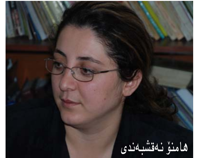
هامنۆ نه قشبهندی

یهک لهو خالانهی له دهسته به ریوونی ماف و نازادییه کانی ژنان و هاتنه دیی کومه لگایه کی پابهندی یه کسانیی ره گهزی دهوریکی بهرچاوی ههیه، به شداریی خودی ژنانه له گۆر په پانه سیاسیه کانددا. "بۆ کوردستان" سه بارهت به راده و شیوازی دهوری ژنان له سه ر ژیان و بریاراتی حیزبه سیاسیه کانی رۆژه لاتتی کوردستان، به تاییه تی له ناستی رېبەرایه تی حیزبه کانددا، وتویژی له گه ل دهسته یهک له چالاکانی بواره کانی سیاست و ماف و نازادیی ژناندا پیکهینا.