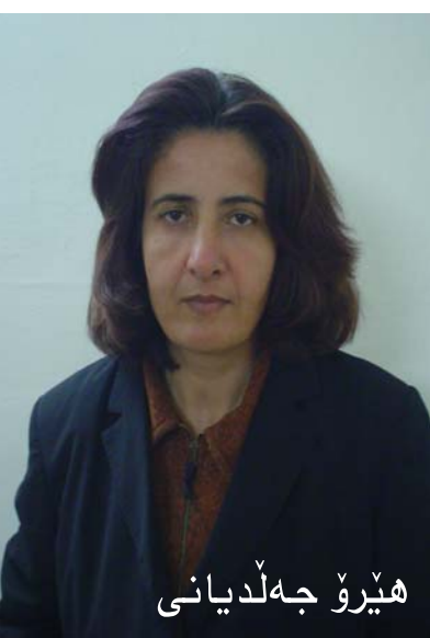
هیرۆ جه لیدیانی

پێشکه وتوو، شه وه تیشه له ریشه ی بزوتنه وه ی ژنان و هه رکه تی سیاسیی ژنان شه ات. من له گه ل شه وه دا زۆر زۆر موخالیفم! من شه و نازادییه م ناوئ خودی خه باتم بۆ نه کردی. یانی نامه وئ پیاویک نازادیم بۆ دابین بکات. چه ز شه که م خودی شان به شانی پیاویک به ره و نازادی برۆم.